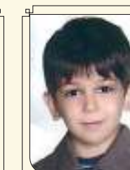
محمدیویا البرزبان دوم ابتدایی رتبه خیلی خوب